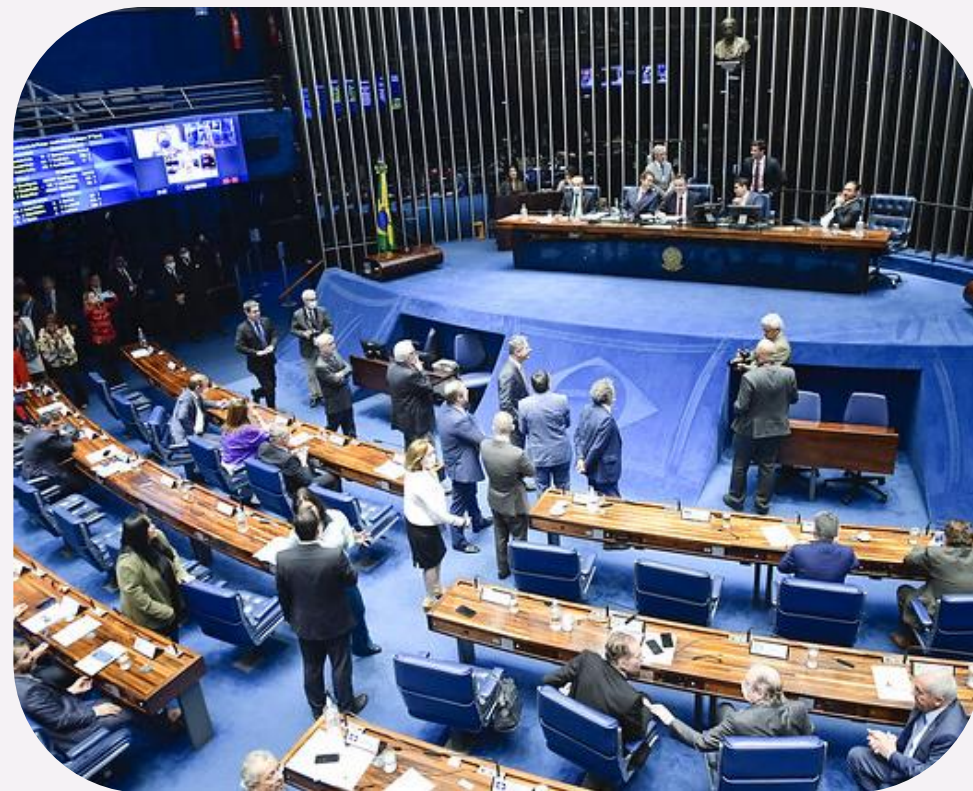
Sessão do Senado para votação da PEC da Transição (PEC 32/22).

Além de atuar ativamente em conjunto com a Frencoop na busca de resultados positivos para o cooperativismo, o Sistema OCB também participou de Audiências Públicas e atuou pela obstrução de projetos prejudiciais para o coop.