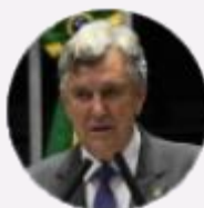
Vice-Presidente no Senado: senador Luis Carlos Heinze (RS)