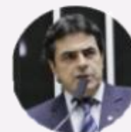
Vice-Presidente na Câmara: deputado Domingos Sávio (MG)