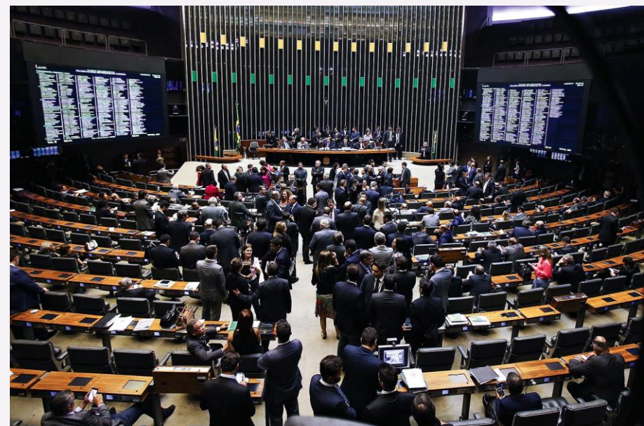
Plenário da Câmara dos Deputado em sessão.

Além disso, a Frencoop também conta com uma Diretoria formada por parlamentares que estão na linha de frente dessa atuação em defesa das cooperativas no Congresso Nacional. Veja a seguir!