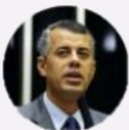
Presidente: deputado Evair de Melo (ES)