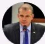
Deputado Roman (PR)