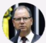
Deputado Alceu Moreira (RS)