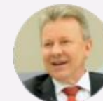
Deputado Celso Maldaner (SC)