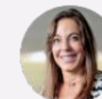
Senadora Mara Gabrilli (SP)