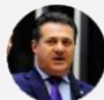
Deputado Giovani Cherini (RS)