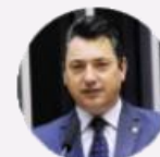
Deputado Sergio Souza (PR)