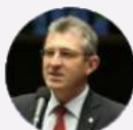
Deputado Heitor Schuch (RS)