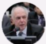
Deputado Mauro Nazif (RO)