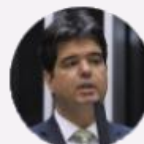
Deputado Ruy Carneiro (PB)