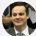
Deputado Capitão Wagner (CE)