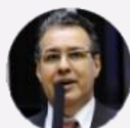
Deputado Capitão Augusto (SP)