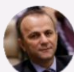
Deputado Hélder Salomão (ES)