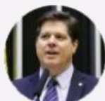
Deputado Baleia Rossi (SP)