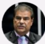
Senador Nelsinho Trad (MS)