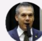
Deputado Zé Silva (MG)