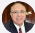
Deputado Arnaldo Jardim (SP)