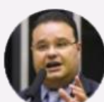
Deputado Fábio Trad (MS)